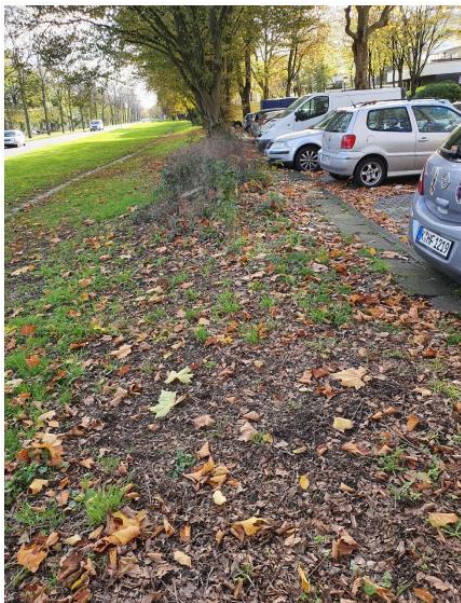
hier: Wiederaufforstung von gefälltten Bäumen

Wir freuen uns über diesen Beschluss, da wir dem „heißen“ Stadtteil Neubrück entgegenwirken wollen und so jedes Grün/Baum willkommen heißen. Da wir als Bürgerverein natürlich die „Essbare Stadt“ dabei haben wollen, haben wir direkt Kontakt zur Koordinatorin aufgenommen und hoffen nun, dass die Wiederaufforstung nun mit Apfel-, Walnuss und anderem essbaren Pflanzen durchgeführt wird. Gerne würden wir zu den einzelnen Pflanzen, dann auch Paten haben. Hier gilt es auf die Pflanzen/ Bäume